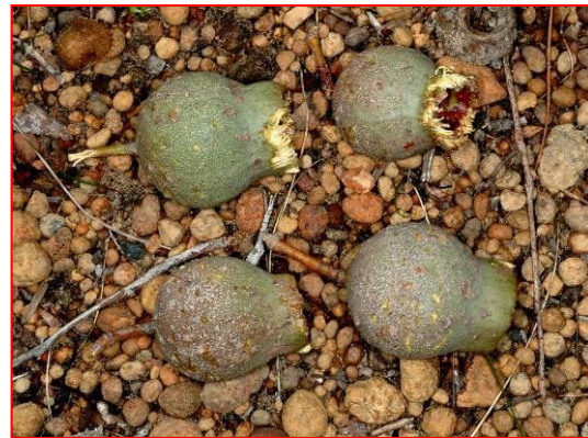
Nueces Marri masticadas por Cacatúa de Baudin